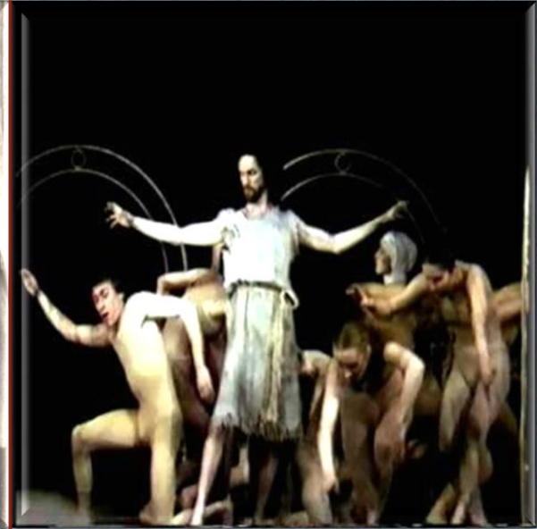
Гедрюс Мацкявичюс «Преодолен ие»