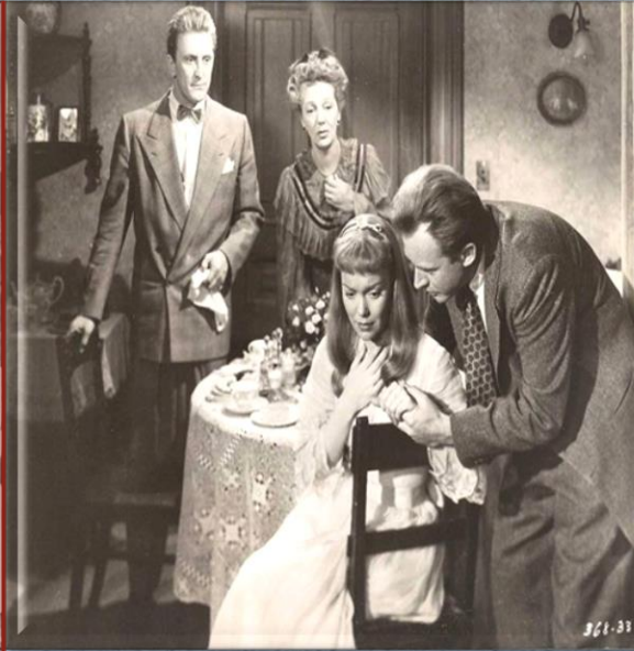
Тенниси Уильямс «Стеклянный зверинец»