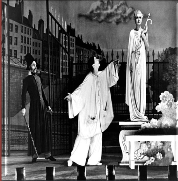
Жан Луи Барро «Вокруг Матери»